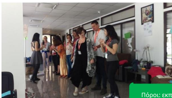
Πόροι: εκπαιδευμένος συντονιστής, εκπαιδευμένος Τζόκερ, ασφαλής χώρος, 2 εβδομάδες έως 3 μήνες

Τέλος, το Forum Theatre απαιτεί χώρο – αφενός για να προετοιμαστούν οι μη ηθοποιοί, αφετέρου για να δει το κοινό την παράσταση. Και οι δύο χώροι (αν όχι οι ίδιοι) θα πρέπει να είναι προσβάσιμοι, ασφαλείς και να σέβονται τους μη ηθοποιούς ή την ομάδα-στόχο (π.χ. δεν είναι όλοι οι χώροι προσβάσιμοι για φτωχούς νέους ή ασφαλείς για νέους LGBTQ+).