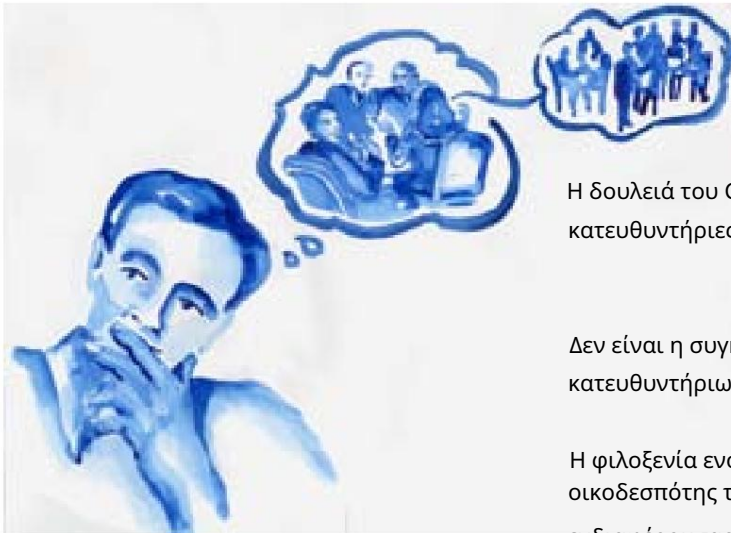
εικονογράφηση Nancy Margulies

Η δουλειά του Café Host είναι να δει ότι οι επτά αρχές σχεδιασμού - οι κατευθυντήριες γραμμές για διάλογο και δέσμευση - εφαρμόζονται.