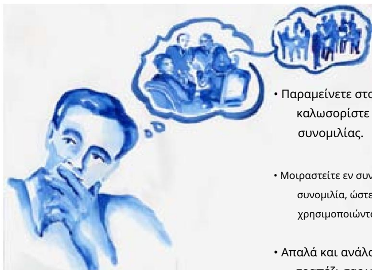
εικονογράφηση Nancy Margulies